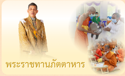
พระราชทานภัตตาหาร

MCU Council Newsletter Mahachulalongkornrajavidyalaya University 29 April 2026 Resolutions of the University Council Meeting No. 4/2026