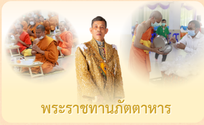
พระราชทานภัตตาหาร

จดหมายข่าวสภามหาวิทยาลัย มหาวิทยาลัยมหาจุฬาลงกรณราชวิทยาลัย ๒๙ เม.ย. ๒๕๖๙ มติการประชุม ครั้งที่ ๔/๒๕๖๙