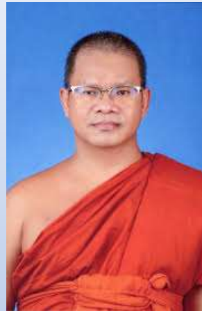
พระครูศรีมงคลปริยัติกิจ ผู้อำนวยการวิทยาลัยสงฆ์