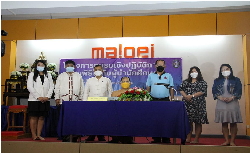
พระมหาสมศักดิ์ สติสัมปนโน: โครงการอบรมเชิงปฏิบัติการศาสนพิธีให้กับผู้นำนักศึกษา