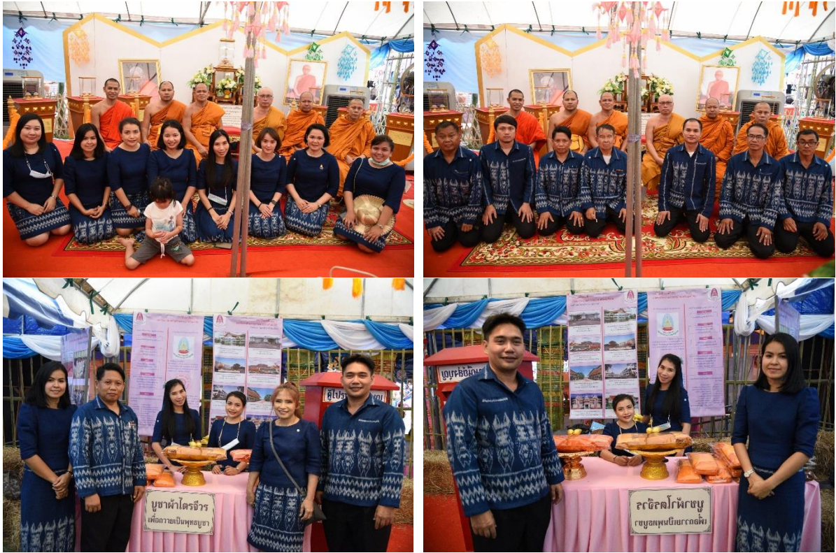
๒) โครงการมูทิตาสักการะ และโครงการเนื่องในวันสำคัญทางพระพุทธศาสนา