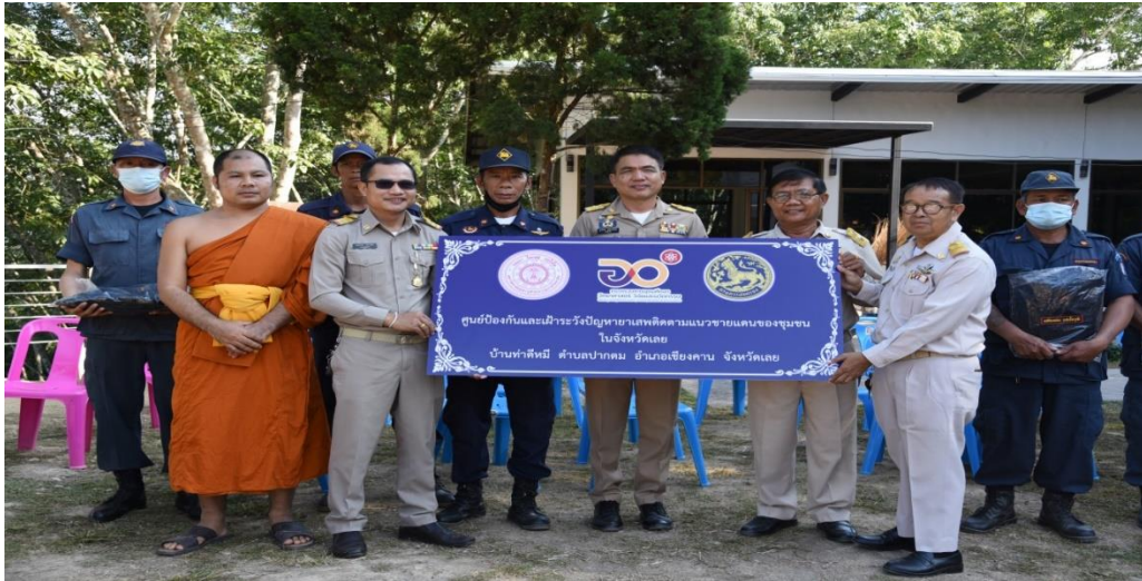
พระมหาสมศักดิ์ สติสัมปนโน: ด้านการป้องกันและเฝ้าระวังปัญหาเสพติดตามแนวชายแดนในจังหวัดเลย