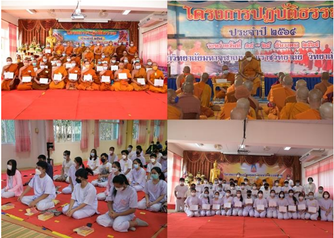
๓) โครงการประกันคุณภาพการศึกษา